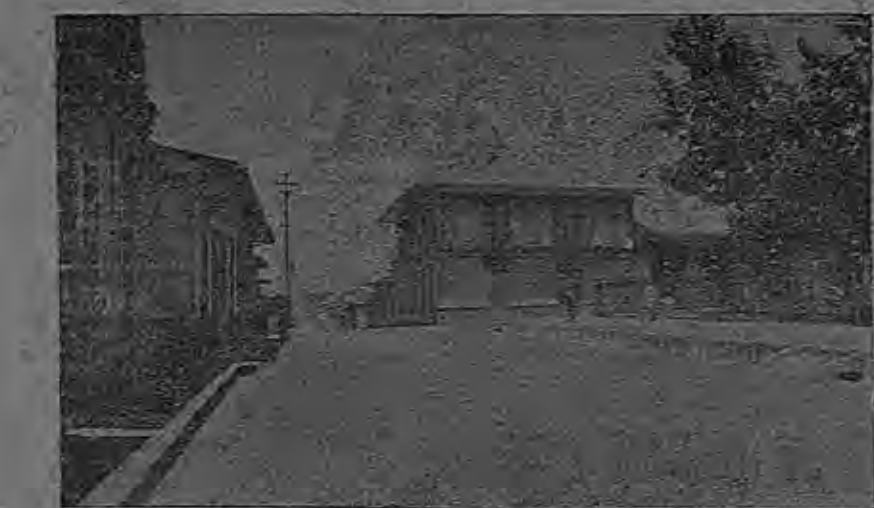
LA CASA DE LA FAMILIA MORALES-GUTIERREZ