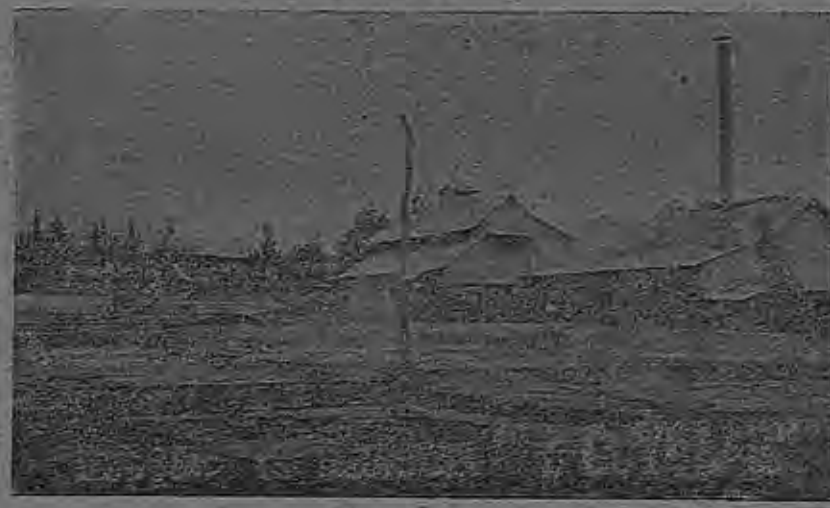
EL BENEFICIO EN SAN FRANCISCO DE HEREDIA